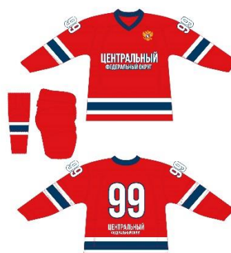
Сборная Центрального ФО