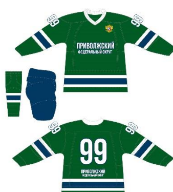
Сборная Приволжского ФО