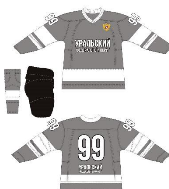
Сборная Уральского ФО