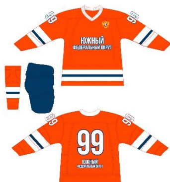
Сборная Южного ФО