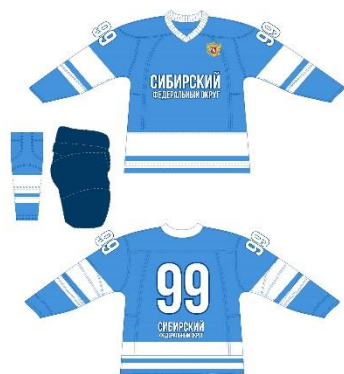
Сборная Сибирского ФО