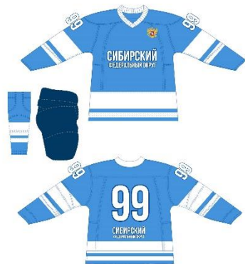
Сборная Сибирского ФО