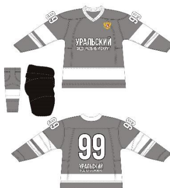
Сборная Уральского ФО